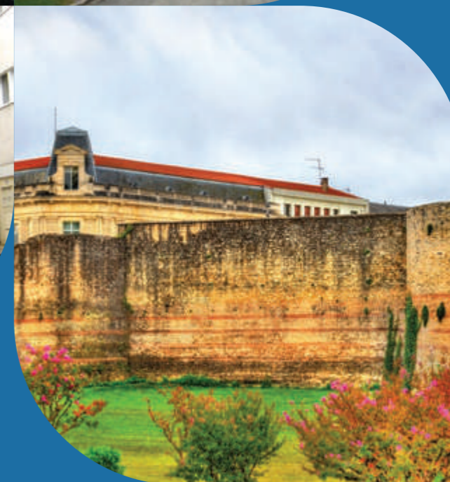
Les remparts Gallo-Romains